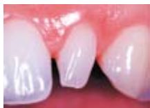
Einzelzahn ohne ...

Früher musste man Zähne, die durch Verfärbungen, Lücken oder abgebrochene Ecken ästhetisch beeinträchtigt waren, mit Kronen versehen. Kronen sind zwar in der Zahnheilkunde ein bewährtes Behandlungsmittel, sie haben aber den Nachteil, dass man bei der Vorbereitung des Zahnes auch gesunde Zahnanteile beschleifen muss, damit der Zahn später nicht zu voluminös wird. Heute stehen dagegen neue Materialien und neuartige Klebetechniken zur Verfügung, die es ermöglichen, einzelne Zähne oder ganze Zahnreihen dauerhaft ästhetisch zu optimieren, ohne dass zu viel gesunde Zahnsubstanz geopfert werden muss. Lassen Sie sich von Ihrem Zahnarzt beraten. Er wird Ihnen gerne die Möglichkeiten der modernen ästhetischen Zahnheilkunde erläutern, die für Sie in Frage kommen.