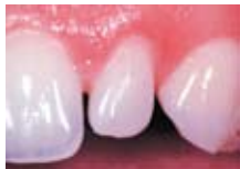
... und mit Veneer